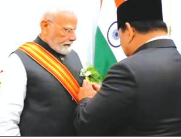
▶ प्रधानमंत्री ने इंडोनेशिया की सरकार और वहां की जनता के प्रति आभार व्यक्त किया

एजेंसी, जकार्ता। इंडोनेशिया के राष्ट्रपति प्रबोवो सुबियांतो ने प्रधानमंत्री नरेन्द्र मोदी को मंगलवार को देश के सर्वोच्च नागरिक सम्मान 'वितांग आदिपुर्णा ऑफ द रिपब्लिक ऑफ इंडोनेशिया' से सम्मानित किया। राष्ट्रपति सुबियांतो ने जकार्ता में आयोजित विशेष समारोह में प्रधानमंत्री मोदी को यह प्रतिष्ठित सम्मान प्रदान किया। यह इंडोनेशिया का सर्वोच्च नागरिक सम्मान है। यह सम्मान उन लोगों को दिया जाता है जिन्होंने इंडोनेशिया की अखंडता, संप्रभुता और सम्मान के लिए अद्भुत कार्य किए हैं। सम्मान प्राप्त करने के बाद प्रधानमंत्री ने इंडोनेशिया की सरकार और वहां की जनता के प्रति आभार व्यक्त किया। उन्होंने कहा, 'आज सुबह मुझे बहुत स्नेह और आदर के साथ इंडोनेशिया का सर्वोच्च सम्मान दिया गया है। यह