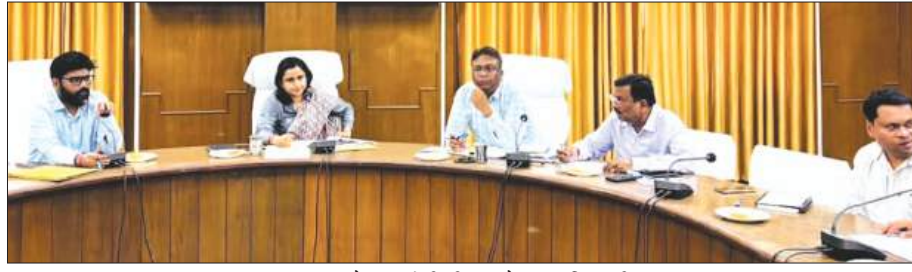
बैठक लेती डीएम मौजूद अधिकारियों