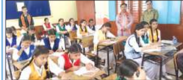
प्रतियोगिता में भाग लेती छात्राएं