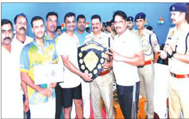
▶ प्रतियोगिता में 11 जनपदों की टीमों ने किये प्रतिभाग ▶ पुरुष वर्ग में प्रथम बस्ती, द्वितीय कुशीनगर महिला वर्ग में प्रथम श्रावस्ती, द्वितीय बहराइच रहा

इंदिरा गांधी स्पोर्ट्स स्टेडियम, बहराइच में चल रहे गोरखपुर जेन की 43वीं अन्तर जनपदीय बैडमिंटन वलस्टर (बैडमिंटन व टेबल टेनिस) महिला/पुरुष प्रतियोगिता वर्ष-2026 का सफल समापन हुआ। गोरखपुर जेन की 43वीं अन्तर जनपदीय बैडमिंटन वलस्टर (बैडमिंटन व टेबल टेनिस) (महिला/पुरुष) प्रतियोगिता-2026 का इंदिरा गांधी स्पोर्ट्स स्टेडियम में सफल सम्पन्न कराया गया। इसमें गोरखपुर जेन के सभी 11 जनपदों (गोरखपुर, देवरिया, कुशीनगर, महाराजगंज, बस्ती, संत कबीर नगर, सिद्धार्थनगर, गोण्डा, बलरामपुर, श्रावस्ती, बहराइच) की टीमों ने प्रतिभाग किया। पुरुष वर्ग बैडमिंटन प्रतियोगिता में जनपद बस्ती ने प्रथम स्थान तथा जनपद कुशीनगर