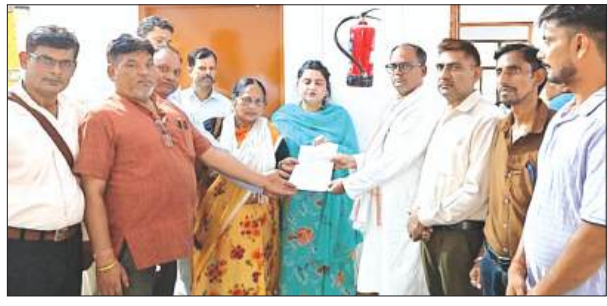
नगर मजिस्ट्रेट को ज्ञापन सौंपते लोग

जनपद के जागरूक नागरिकों और सामाजिक कार्यकर्ताओं द्वारा गृह मंत्री संबोधित ज्ञापन जिला अधिकारी को सौंपा। ज्ञापन में हिंदू समाज के आर्थिक हितों, सांस्कृतिक शुचिता, सामाजिक सुरक्षा, खाद्य सुरक्षा और जनसांख्यिकी चुनौतियों के निवारण हेतु खरित कानूनी और प्रशासनिक उपायों की मांग की गई है। कार्यकर्ताओं का कहना है कि पीढ़ी-दर-पीढ़ी चले आ रहे पारंपरिक और पारिवारिक कौशल (जैसे-फर्नीचर, खाद्य प्रसंस्करण, केटरिंग, टेलरिंग, नाई, धोबी आदि) के प्रति हिंदू समाज के युवाओं में पड़्यंत्र के तहत उपेक्षा और घृणा का भाव पैदा किया जा रहा है। इसके चलते युवा पारंपरिक व्यवसायों