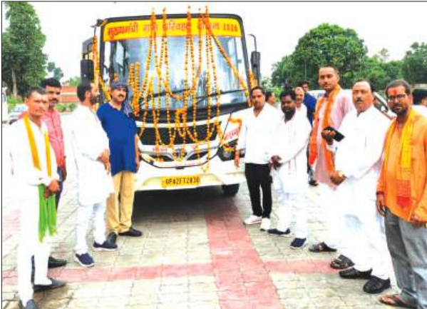
हैदराबाद बाराबंकी समृद्धि न्यूज़।

विधानसभा क्षेत्र हैदराबाद में हैदराबाद बस अड्डे से मुख्यमंत्री ग्रामीण बस सेवा योजना के अंतर्गत हैदराबाद-त्रिवेदीगंज-मंगलपुर-मोहम्मदपुर-अचकामऊ-कोठी होते हुए बाराबंकी तक संचालित होने वाली नई बस