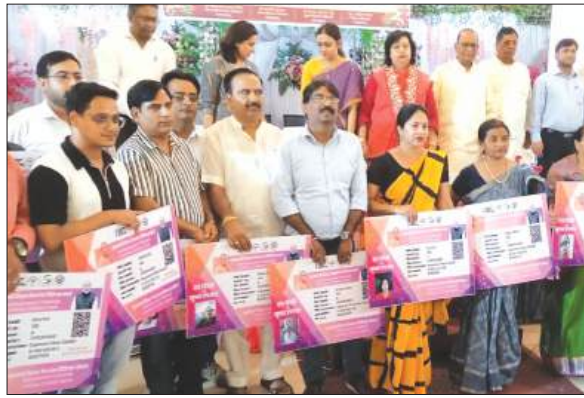
कैशलेस कार्ड के साथ शिक्षक व नर्स आदि

कैशलेस चिकित्सा कार्ड वितरण, डीबीटी, शिक्षकों के सामाजिक सुरक्षा हेतु एमओयू के साथ उवन और स्वच्छ एवं हरित पुरस्कार इन चार कार्यक्रमों के मुख्यमंत्री योगी आदित्यनाथ द्वारा शुभारंभ किया गया। जनपद मुख्यालय पर कार्यक्रम का आयोजन हुआ। जिसमें मुख्यमंत्री कैशलेस चिकित्सा योजना के कार्ड वितरण कार्यक्रम सम्पन्न हुआ। माध्यमिक शिक्षक व बेसिक शिक्षा विभाग के शिक्षक को कार्ड वितरित किये गये। इस जनकल्याणकारी योजना के माध्यम से प्रदेश के शिक्षकों एवं कर्मचारियों को स्वास्थ्य सुरक्षा का प्रभावी संबल प्रदान करने हेतु मुख्यमंत्री का आभार व्यक्त किया गया। आयोजन में बड़ी