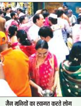
जैन मुनियों का स्वागत करते लोग