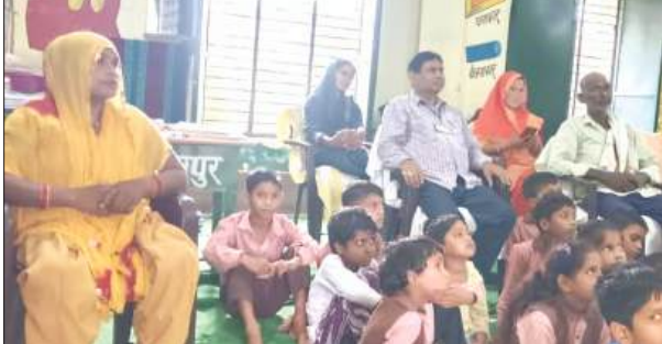
सजीव प्रसारण देखते अभिभावक व शिक्षक बच्चे

विकास खण्ड कायमगंज के प्राथमिक विद्यालय मदारपुर में स्कूल प्रबंधन समिति की बैठक में अभिभावकों ने डीबीटी शुभारंभ का सजीव प्रसारण देखा। मुख्यमंत्री योगी आदित्यनाथ द्वारा शिक्षक, शिक्षा मित्र, अनुदेशक एवं रसोईया के लिए कैशलेस चिकित्सा योजना एवं बच्चों को दी जाने वाली निशुल्क यूनीफार्म, बैग, जूता-मोजा, स्वेटर एवं स्टेशनी हेतु 1200 रुपए की धनराशि डीबीटी के माध्यम से अभिभावकों के खातों में भेजने का शुभारंभ किया। इस अवसर पर भारतीय स्टेट बैंक ने प्राथमिक व माध्यमिक विद्यालयों में कार्यरत स्टाफ के लिए वेतन खाते के एमओयू पर हस्ताक्षर किए। स्कूल